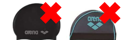
このシリーズは両面に文字が入っているのでNG。要注意！