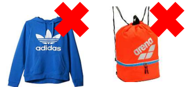
大きいロゴは1つでもNG。ロゴ(文字)は1か所+大きさ制限あり