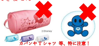
カバンやTシャツ等、特に注意！