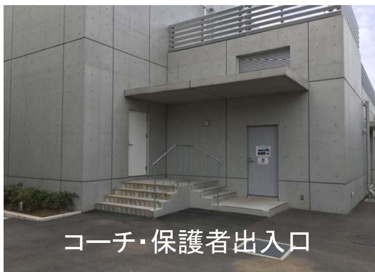
コーチ・保護者出入口